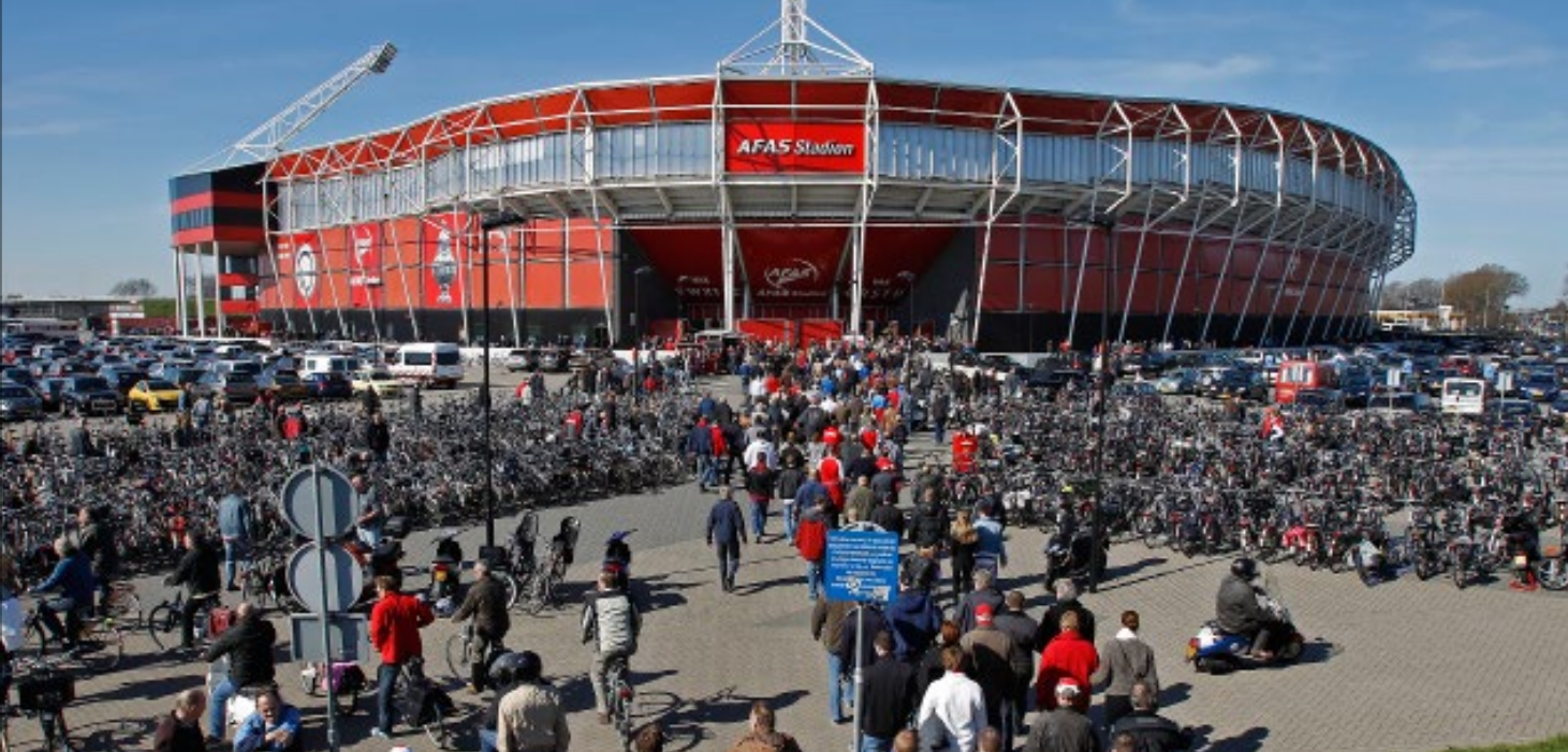
Liefhebbers onderweg naar een voetbalfeestje van AZ

Terugblikkend valt het de burgemeester vooral op dat het na-ijleffect beperkter was dan hij had verwacht. Hij is tevreden over de manier waarop alles is verlopen. ‘We hadden binnen de vierhoek hele directe lijnen met elkaar en de chemie tussen de groepsleden was goed. Natuurlijk, er gaan echt wel eens dingen mis, maar het is toch een groot goed dat we in het openbaar bestuur bij een crisis zo snel kunnen schakelen.’ ● MvdT