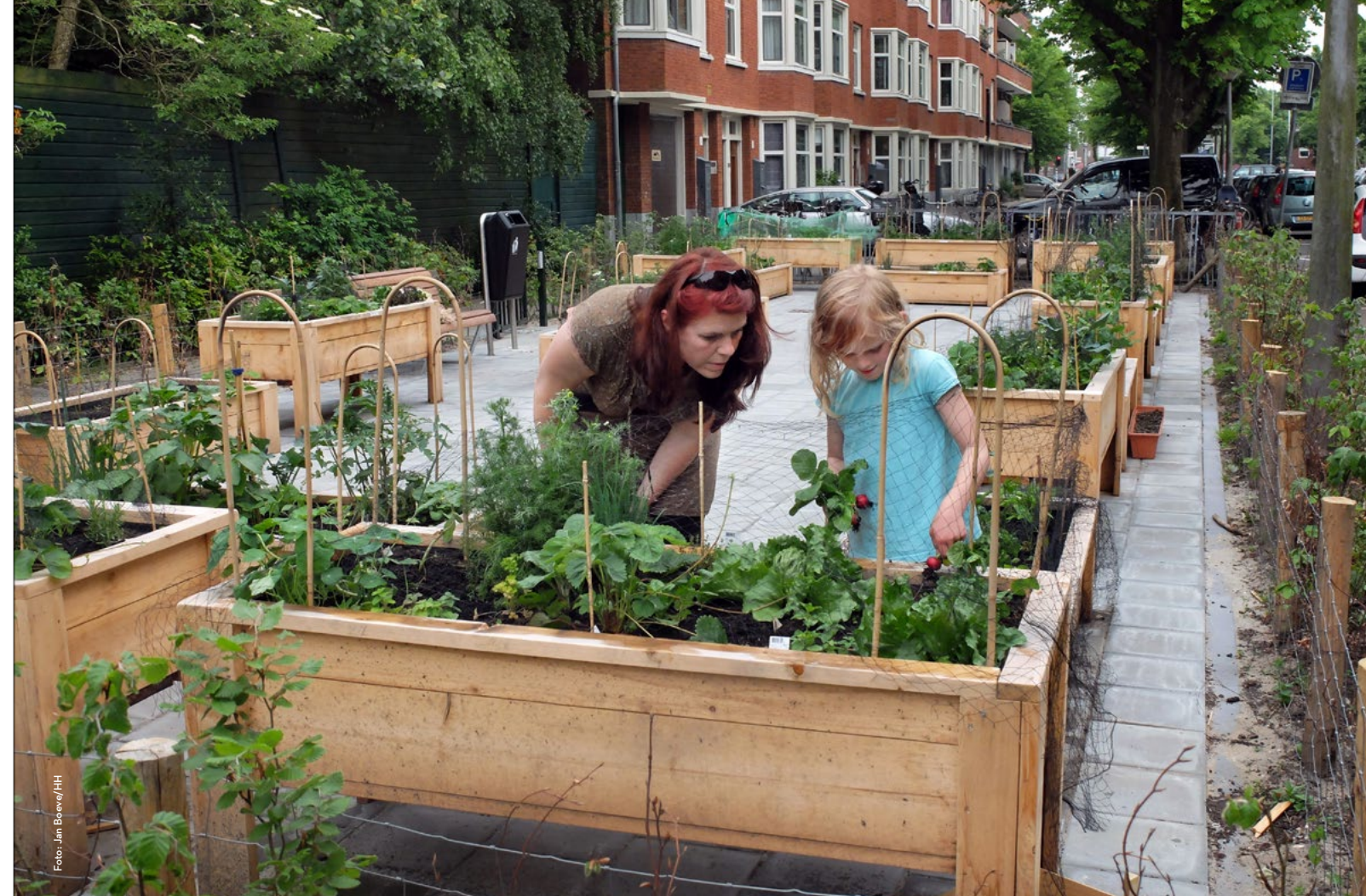
Project in Amsterdam-West waar buurtbewoners in plantenbakken groenten en kruiden verbouwen

Ook wethouder Hoekstra worstelt met die vraag: meer of minder regels? 'Ik vind dat Nederland is